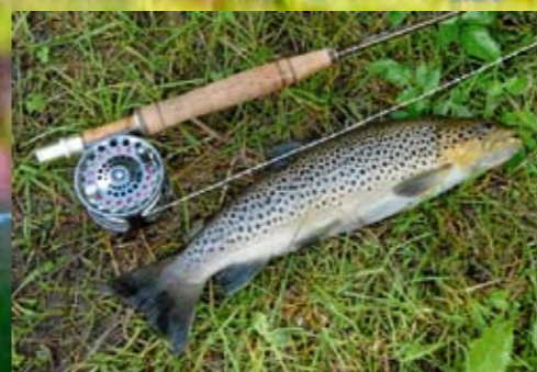
MATFISK 1: Mellom 35 og 40 cm kan du avlive en fisk pr. døgn. Min ørret på 0,8 kilo ligger på øvre grense.

Mange drar årlig til Hallingdalselva og Hemsila med håp om å fange drømmeørreten. Få har så langt snakket om Holselva, men der er muligheten kanskje enda større til å ta den virkelig store.